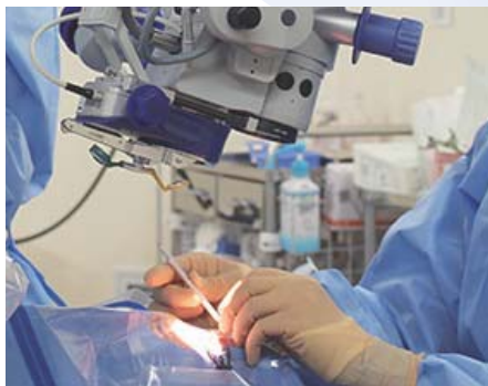
白内障手術 / 緑内障手術