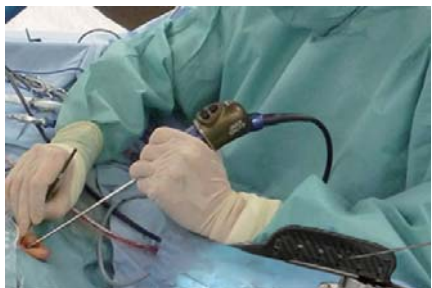
内視鏡下耳科手術