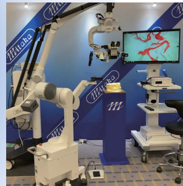
顕微鏡とのセッティング例