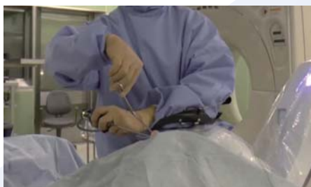
内視鏡下鼻内手術