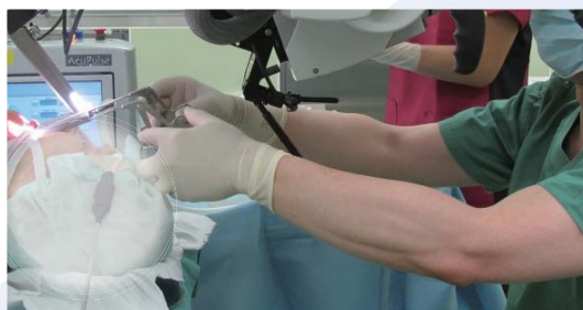
喉頭微細手術 (例) (ラリンゴマイクロサージェリー)